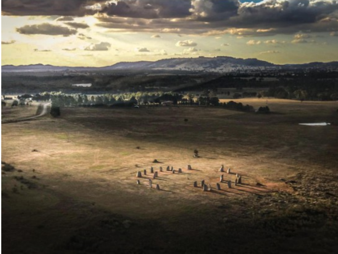
Foto aérea de las piedras de Wollomi en el oeste de Sídney. Son una réplica de Stonehenge.